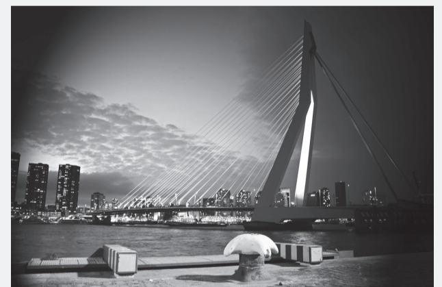
Auch die Erasmusbrücke, Wahrzeichen von Rotterdam, vermag es nicht, Brücken zwischen den verschiedenen Kulturen in Holland zu schlagen.

Infos und Anmeldung zu den Bildungsreisen: bildungsreisen@gruene-akademie.at