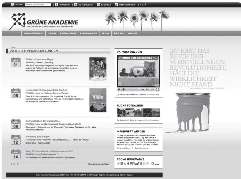
www.gruene-akademie.at, WEBSITE-RELAUNCH am 10.04.2010

Bei Bedarf werden bei unseren Veranstaltungen GebärdensprachdolmetscherInnen eingesetzt. Aus organisatorischen Gründen müssen wir jedoch um eine vorherige Anmeldung unter 0316-822557 oder 0664-8317416 ersuchen. Diese muss spätestens drei Tage vor der jeweiligen Veranstaltung eingelangt sein.