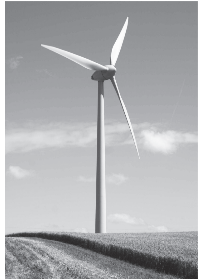
Eine Windturbine im Windpark Nibas in Frankreich. Ein Beitrag zur Energieautonomie.